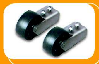
Ruedas de transporte