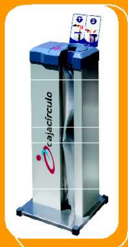
Personalice el KASAPON con su logotipo